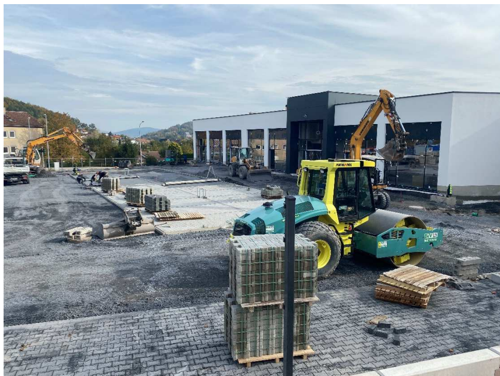
Parkplatz EDEKA am 21.10.2020

Für den Neubau der Edeka an der Gnäleser Straße musste auch der gesamte städtische Parkplatz umgestaltet werden. Richtung Westen wurde dieser erweitert und die vorhandene Böschung mit Stahlbetonelementen gesichert. Als Zu- und Abfahrten konnten die bestehenden weiter genutzt werden.