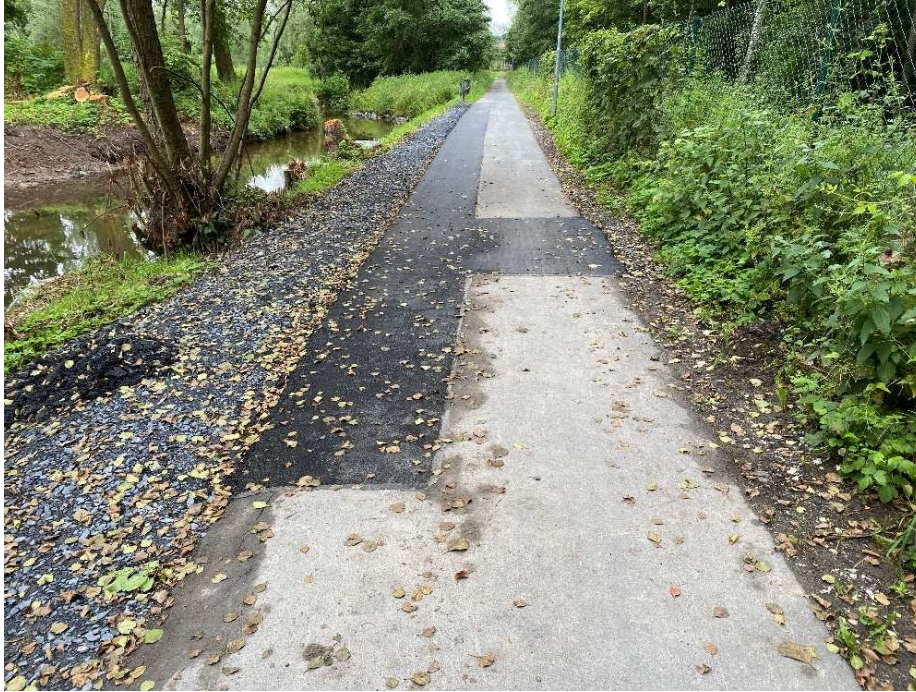
Geh- und Radweg Alexandrinenthal

An der Röden wurde im Bereich Alexandrinenthal durch das Wasserwirtschaftsamt Kronach ein Stück Ufermauer abgerissen. Die neu entstandene Böschung musste mit Wasserbausteinen gesichert werden. Hier musste ebenfalls ein Teil des Geh- und Radweg der unterspült war erneuert werden.