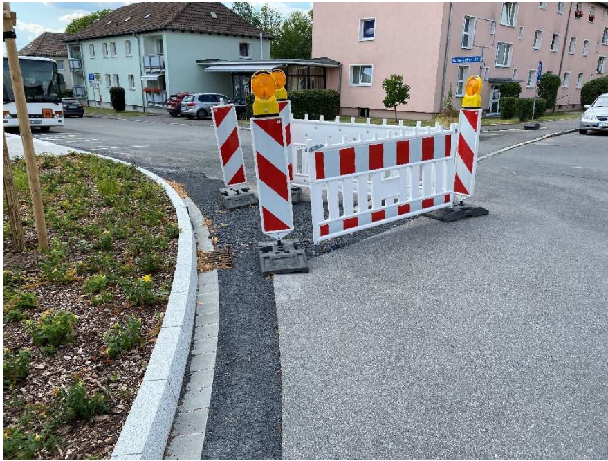
Martin-Luther-Str. am 14.07.2020