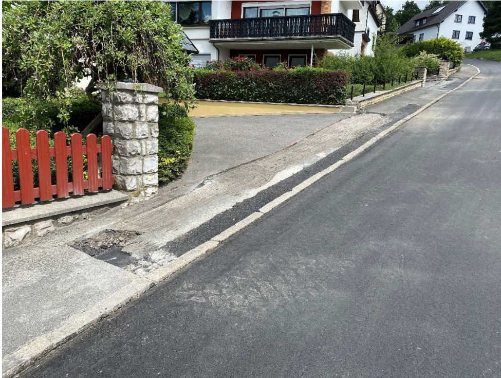
Weinbergstraße am 25.06.2020

Im Stadtteil Mönchröden konnte nun auch der Abschnitt Weinbergstraße von der Lindleite bis zur Nußleite saniert werden. Auf einer Strecke von etwa 250m erhielt die gesamte Fahrbahn eine neue Asphaltdeckschicht. Teilweise wurden die Bordsteine reguliert und schadhafte Bereiche im Gehweg erneuert.