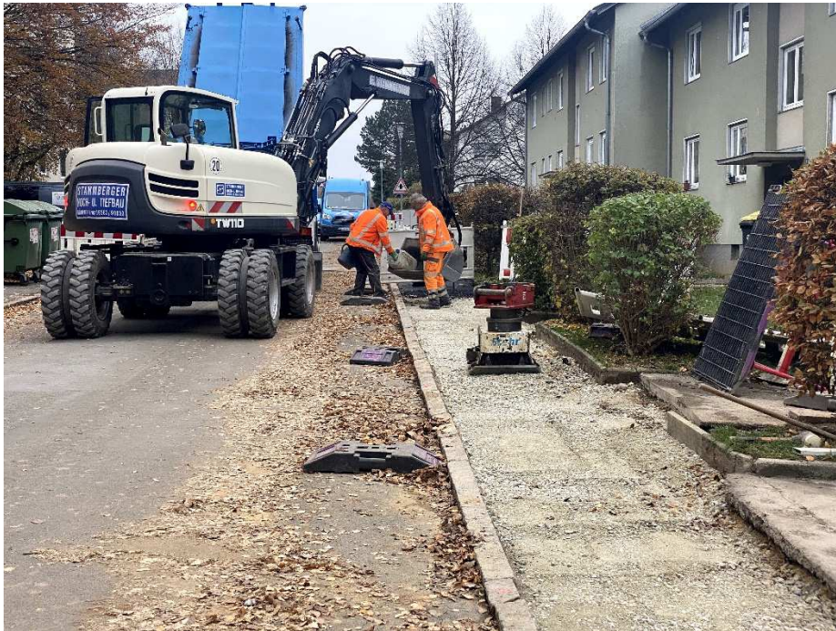
Gehwegbau Stettiner Straße am 10.11.2020

In der Martin-Luther-Straße wurde in Verbindung mit den Außenanlagen der Mittelschule ebenfalls der Fahrbahnbereich angepasst.