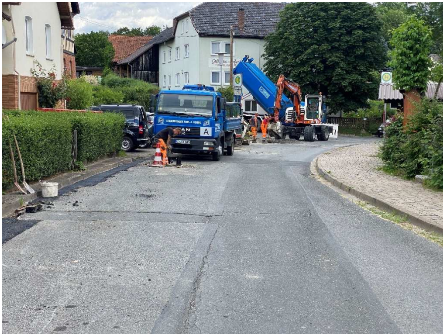
Randplattenausbau am 01.07.2020

Weiterhin wurde im Stadtteil Weißenbrunn auch noch die gesamte Mergelgasse saniert.