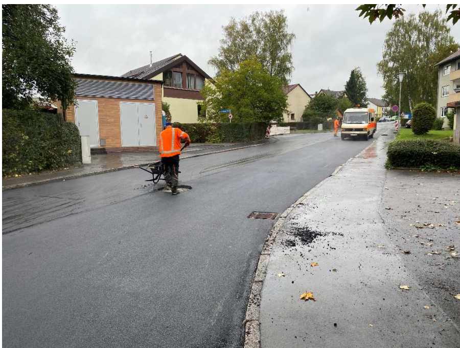
Asphalteinbau Berliner Straße am 13.10.2020