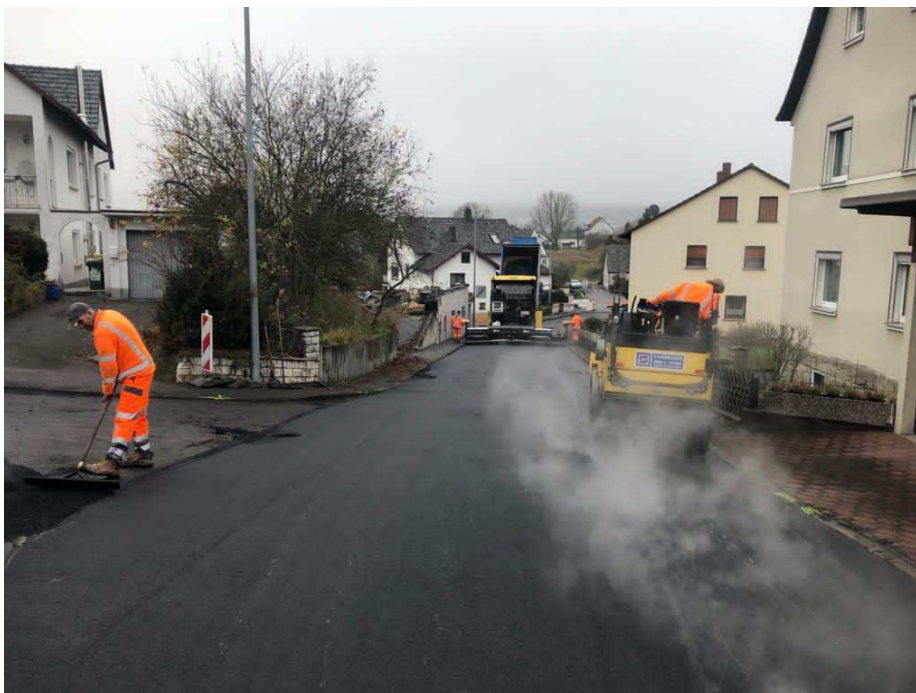
Waldstraße am 13.11.2020

Die Waldstraße wurde von der Kreuzung Stockäcker bis zum aktuellen ausbauende mit einer neuen Asphaltdeckschicht saniert werden. Weiterhin konnte der Übergang zum unbefestigten Teil verändert und somit die Wasserführung verbessert werden. Der Gehwegbereich im Bereich Hausnummer 3 war durch einen bestehenden Baum ebenfalls stark sanierungsbedürftig. Hier konnte in Verbindung mit den Asphaltarbeiten in der Fahrbahn der Abschnitt im Gehweg ebenfalls in Stand gesetzt werden.