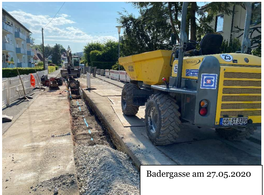
Badergasse am 27.05.2020

Im Stadtteil Einberg wurde durch die Stadtwerke Rödental der zweite Abschnitt in der Badergasse eine neue Wasserleitung verlegt. Zusätzlich wurden in diesem Bereich auch Leitungen der Stadtnetz sowie der Telekom im Gehweg erneuert. Die Stadt Rödental hat in Zuge des Unterhalts einige schadhafte Restbereiche in der Fahrbahn und im Gehweg mit übernommen.