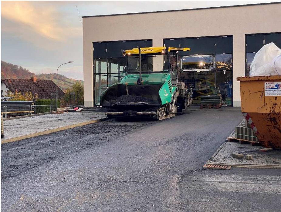
Asphalteinbau am 28.10.2020